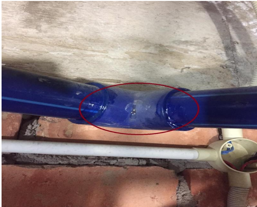
Gambar diatas: kebocoran paip sambungan ditandas wanita (bulatan)