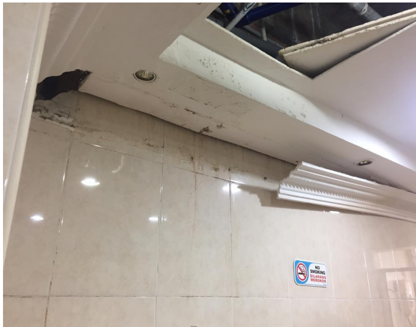
Gambar diatas: Kerosakan Siling ditandas lelaki (disebelahnya)